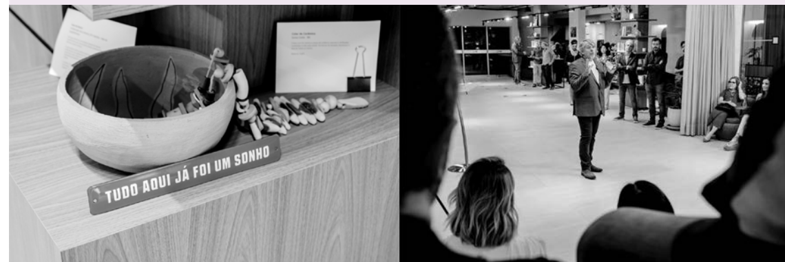
Arte em exposição