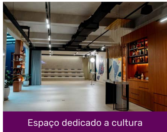
Espaço dedicado a cultura

A Casa Une oferece ferramentas e recursos para a construção de uma visão sistêmica, capacitando indivíduos e organizações a navegar com maestria os desafios do presente e do futuro.