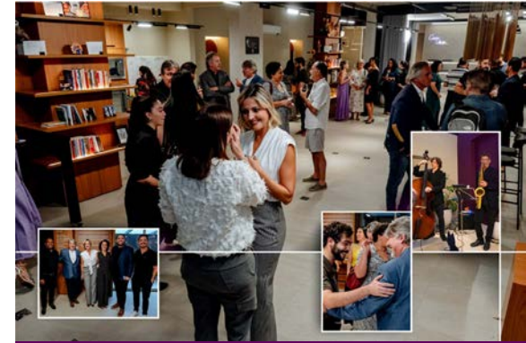
Eventos e reuniões

“Se, a princípio, a ideia não é absurda, então não há esperança para ela. ”